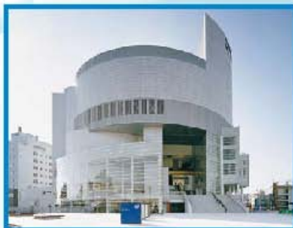
② 高知市文化プラザかるぽーと