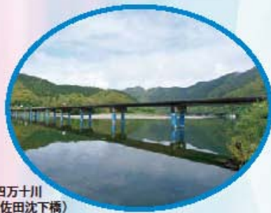
① 四万十川 (佐田沈下橋)